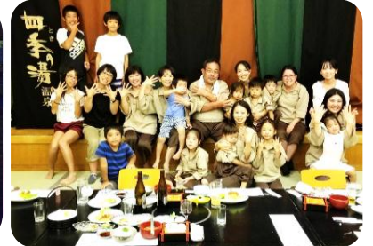
スタッフ一同笑顔で迎えます！