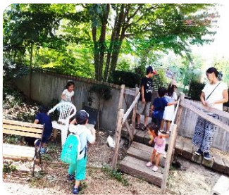
うさぎとふれあい