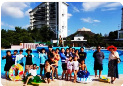
いいお天気!プールで大はしゃぎ